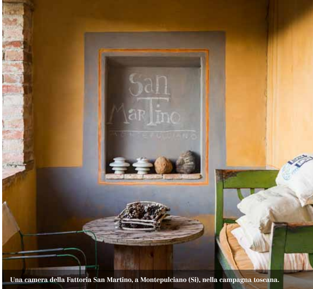
Una camera della Fattoria San Martino, a Montepulciano (Si), nella campagna toscana.

Il borgo, racchiuso da imponenti mura, custodisce palazzi e residenze bellissime edificate nel XVI secolo, quando la città raggiunse il massimo del suo splendore, sotto il dominio della famiglia de' Medici. Il migliore panorama si gode dalla torre del Palazzo del Comune, dove nelle giornate più limpide si possono addirittura vedere Siena e il Monte Cimone. Percorrendo la "Strada del Vino Nobile" ( www.stradavinonobile.it ) s'incontrano paesini che in inverno, per i colori del foliage, la bruma e i