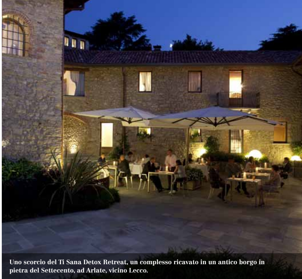
Uno scorcio del Ti Sana Detox Retreat, un complesso ricavato in un antico borgo in pietra del Settecento, ad Arlate, vicino Lecco.

S i supera l'ingresso e si entra in un universo tranquillo dove l'ospitalità è curatissima ed esclusiva. Ci troviamo ad Arlate, a pochi chilometri da Lecco, in un antico borgo di pietra del 1711 dove sono state ricavate 22 suite, con ingresso indipendente, un centro benessere che impiega soltanto prodotti cosmetici biologici certificati. E una Medical Spa all'avanguardia dove eseguire check-up medici per una remise en forme totale. Il ristorante propone una cucina vegana e vegetariana, con alimenti scelti in base al loro potere antiossidante, oltre a programmi "Healtheariani", ovvero salutisti, studiati ad hoc per rivitalizzare il corpo dai danni subiti nell'arco della vita e prevenire l'assorbimento e l'accumulo di tossine. Non a caso, la struttura fa parte dei Veggie Hotels ( www.veggie-hotels.com ), una collezione di alberghi per vegani e vegetariani, che propongono menu privi al 100 per cento di carne e pesce e che organizzano corsi di cucina salutistica e sessioni olistiche come gli stage di yoga, trattamenti benessere e attività ecologiche nella natura. Il Ti Sana Detox Retreat si trova nel cuore del Parco dell'Adda, un luogo