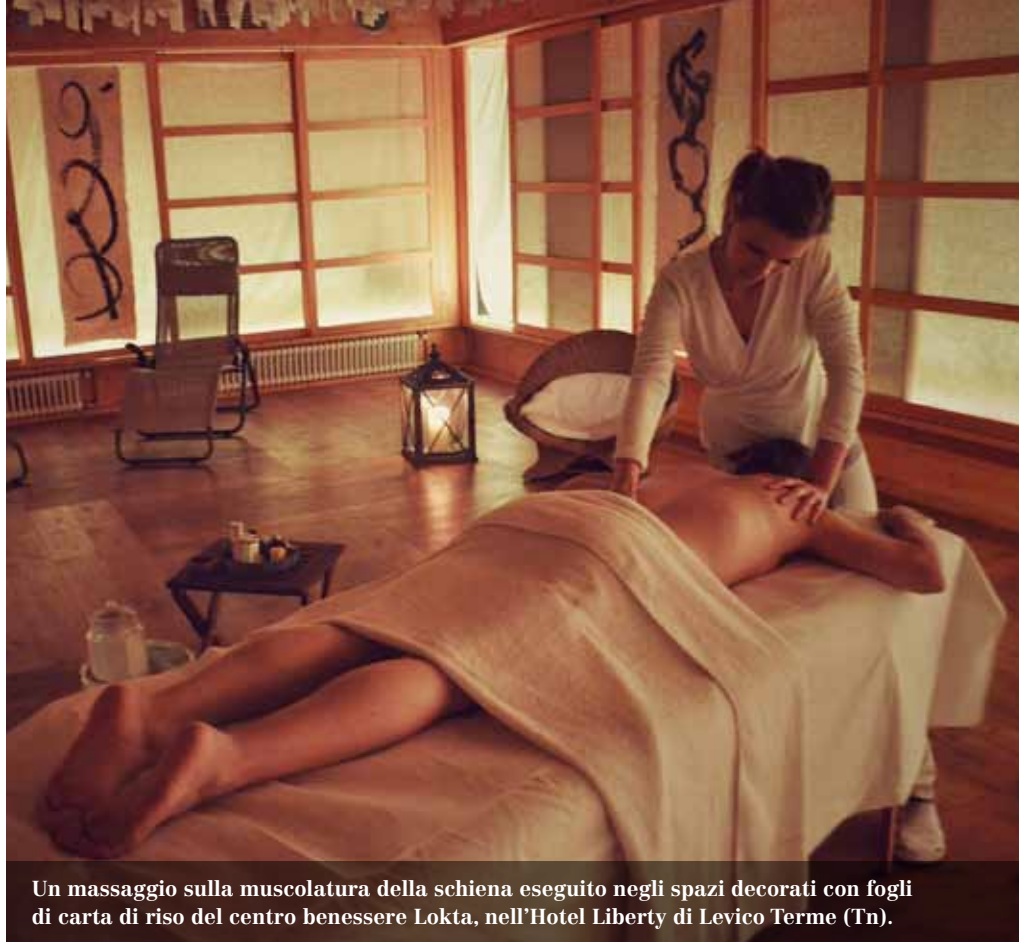
Un massaggio sulla muscolatura della schiena eseguito negli spazi decorati con fogli di carta di riso del centro benessere Lokta, nell'Hotel Liberty di Levico Terme (Tn).

C i si siede a tavola e si gusta ogni pietanza, perché oltre a essere buona da mangiare, fa bene alla salute. Succede alla Salute nel gusto, il nuovo ristorante dell'Hotel Liberty di Levico Terme (Tn), aperto anche a chi non soggiorna in albergo, che propone piatti vegani, vegetariani e senza glutine. Guidato con passione dalla famiglia Crivellaro, l'hotel dispone anche del centro benessere Lokta, che prende il nome dai fogli di carta di riso del Nepal con cui è decorato, dove provare linfodrenaggi, massaggi ayurvedici e shiatsu. A piedi nudi, si cammina sui pavimenti di pino, ascoltando il rumore dell'acqua che scorre e respirando il profumo di essenze naturali. Quattro volte alla settimana sono proposte lezioni di Hatha yoga che si concludono con un rilassamento e una meditazione guidata. La sensazione di benessere si avverte anche nel territorio circostante: oltre a essere stata la città termale prediletta dagli Asburgo, Levico Terme ( www.visitlevicoterme.it ) ha conquistato anche quest'anno la Bandiera Blu. Merito delle acque limpide del suo lago che ricorda, per la sua conformazione, un fiordo norvegese e che si esplora con una passeggiata o una gita in barca. Levico è anche il punto di partenza ideale per raggiungere